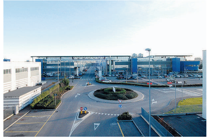
Gli uffici del Polo tecnologico di Desio

l'avvio di importanti e consistenti opere di bonifica attuate con metodologia innovativa che hanno riguardato una superficie complessiva di oltre 150.000 mq. Nel novembre 2002 la realizzazione dei primi edifici, nel 2003 l'insediamento delle prime aziende. Fino all'inaugurazione ufficiale, il 25 settembre 2005. Su quest'area oggi convivono ben 150 aziende che danno lavoro a circa 1.700 persone e producono un fatturato pari a 300 milioni di euro all'anno. Senza dimenticare gli spa-