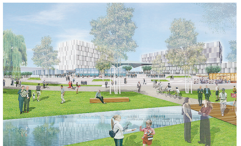
Come sarà il parco di "Ecocity Villasanta"