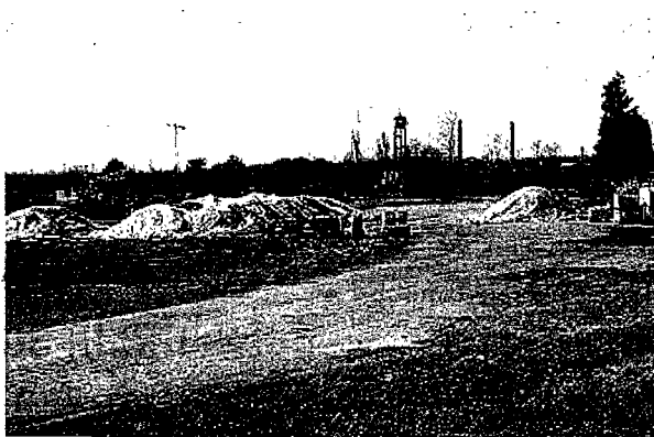
Alcune immagini dell'ex Lombarda Petroli. In alto l'Info Point appena aperto, al centro uno dei rendering di come sarà il comparto, qui sopra l'area com'era durante dei lavori